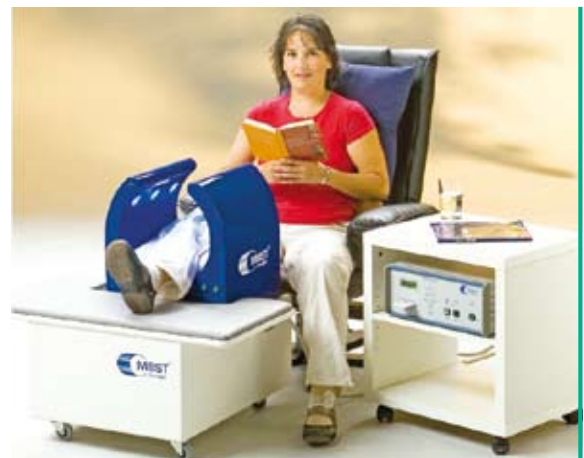
Abb. 1: MBST-Therapiegerät, bestehend aus magnetischer Spule und einer separaten Steuereinheit (Fa. MedTec Medizintechnik GmbH, Wetzlar).